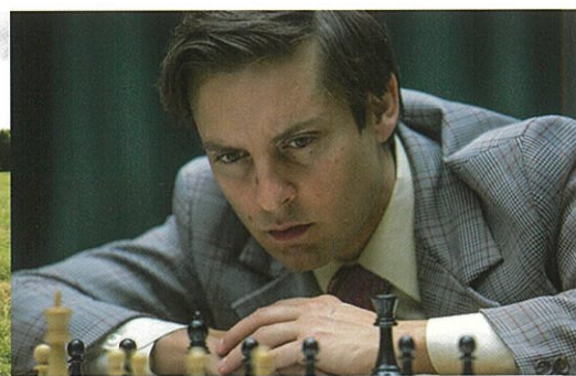
完全なるチェックメイト