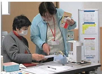
受付での感染対策もバッチリ