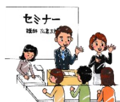
教育フォーラム 「私の受けた教育」 「津波フラッグ」 「今井絵理子議員講演」