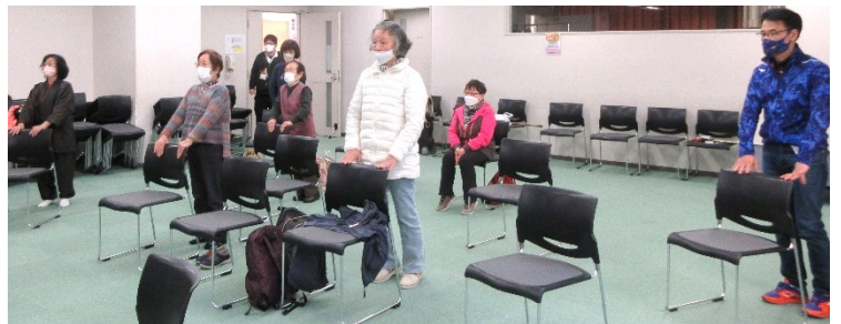
↑ 体操教室 (翠町地域包括支援センター)