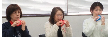
音楽教室発表 (オカリナ サックス)