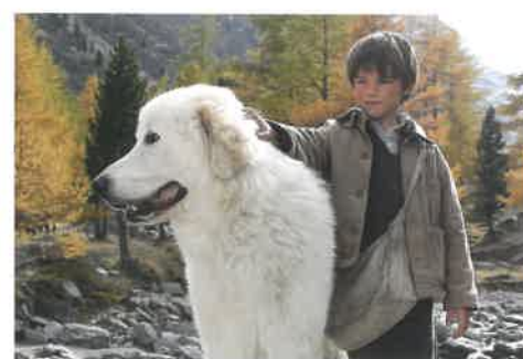
ベル&セバスチャン

© 2013 RADAR FILMS EPITHETE FILMS GAUMONT M6 FILMS ROHNE-ALPES CINÉMA