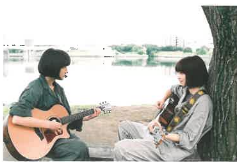
さよならくちびる