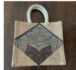
作品例 サイズ A6 絵柄が変わります。